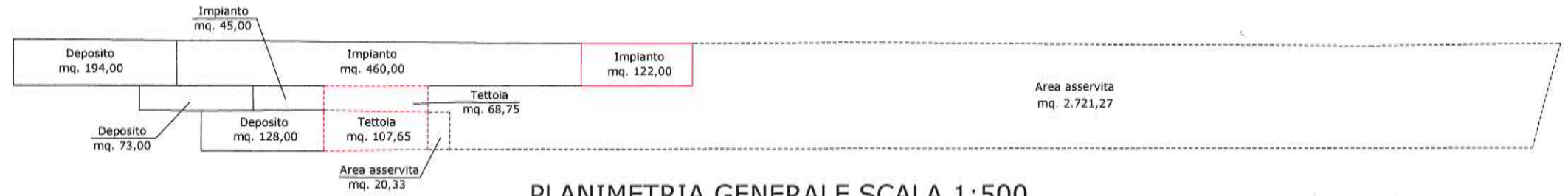
PLANIMETRIA GENERALE SCALA 1:500

AREA TOTALE = mq. 3.940,00 MANUFATTI = mq. 1.022,00 TETTOIA = mq. 176,40 AREA SCOPERTA = mq. 2.741,60